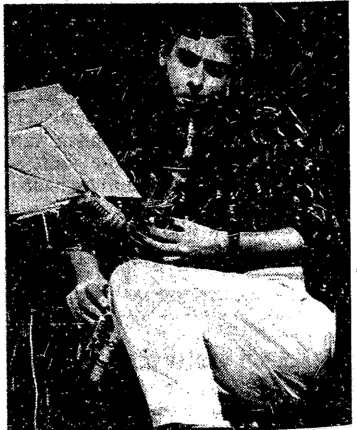
Altsaxer des neuen Klangs: Tim Berne.

es, übrigens neuerdings solche mit auffallendem spanischem Einschlag, die von den drei Virtuosen, zum einen meditativ verhalten, zum andern aber auch in wilder Wucht, zu einem neuen Hörgefühl hingeführt werden. Für den Zuhörer ein nachhaltiges Klangerlebnis, das «Jazz in Willisau» am Freitag, 27. April, 20.30 Uhr, im «Mohren»-