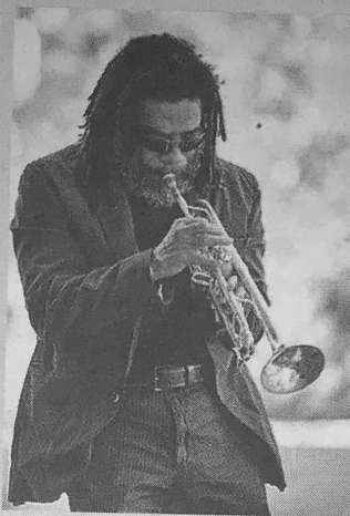
Wadada Leo Smith spielt am Freitag in der Stadtmühle.